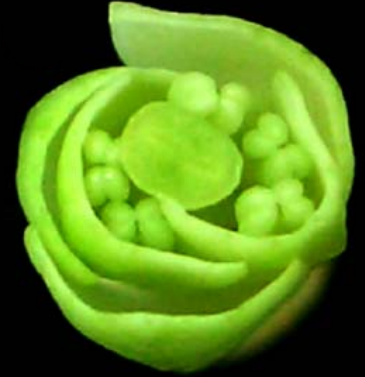
การเรียงกลีบดอกในดอกตูม