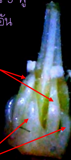
staminode (เกสรเพศผู้เป็นหมัน)