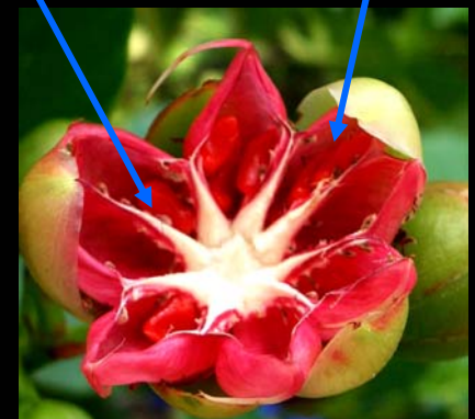
seed (เมล็ด) fruit (ผล)

ดอกลำต้นมีกลีบเลี้ยง 5 กลีบ แยกจากกันเป็นอิสระ ไม่ร่วง ติดทนจนเกิดผล กลีบดอก 5 กลีบ แยกจากกันเป็นอิสระ เกสรเพศผู้จำนวนมาก แยกจากกันเป็นอิสระ เรียงเป็นหลายวงล้อมรอบเกสรเพศเมียเอาไว้ เกสรเพศเมียมีหลายคาร์เพล อาจแยก จากกัน หรือเชื่อมติดกันหลวมๆ แต่ติดอยู่ที่แกนกลางเดียวกัน ก้านยอดเกสรเพศเมีย จำนวนเท่ากับคาร์เพล ลักษณะคล้ายเกสรเพศผู้ รังไข่เหนือวงกลีบ