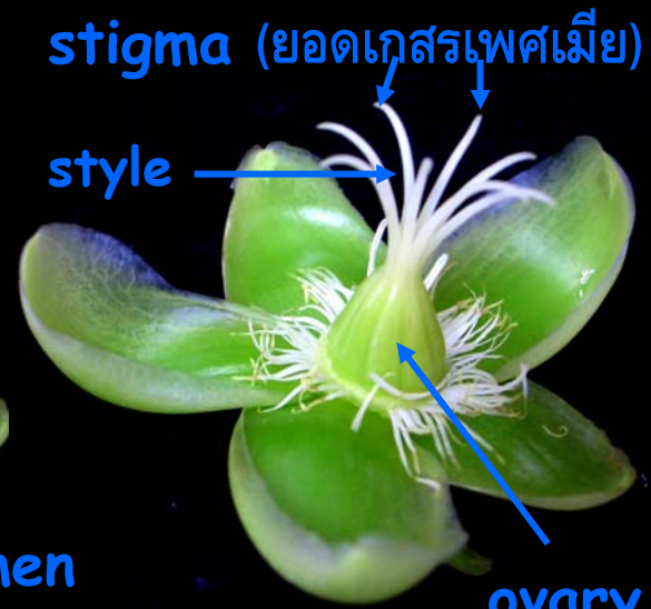
stigma (ยอดเกสรเพศเมีย)