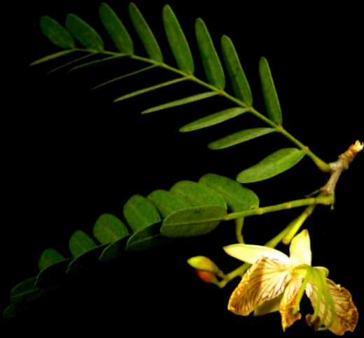
bracteole (ใบประดับย่อย)

มะขามออกดอกเป็นช่อ ตามซอกใบและกิ่ง ดอกย่อยเมื่อยังอ่อนมีใบประดับย่อยสีแดงอมส้ม หุ้มล้อมรอบดอก และแยกหลุดออกเมื่อดอกขยายขนาดขึ้น กลีบเลี้ยงสีขาวอมเหลือง 4 กลีบ เรียงคล้ายรูปกากบาท กลีบดอก 3 กลีบ สีขาวอมส้มอ่อน เส้นกลางใบและเส้นใบของกลีบดอกเป็นสีแดงอมส้ม กลีบดอกจะบิดลงมาอยู่ด้านล่าง กลีบกลางจะมีขอบม้วนเข้าหากันเหมือนเป็นหลอด เกสรเพศผู้ 5 อัน แบ่งเป็นเกสรเพศผู้ปกติ 3 อัน เกสรเพศผู้เป็นหมัน 2 อัน ก้านชูอับเรณูทั้งหมดเชื่อมติดกันเป็นกลุ่มเดียว มีลักษณะแผ่เป็นแผ่น และโค้งคว่ำลง เกสรเพศเมีย 1 อัน รังไข่เหนือวงกลีบ