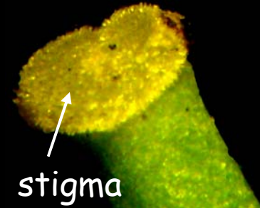
stigma (ยอดเกสรเพศเมีย)