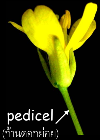
pedicel (ก้านดอกย่อย)