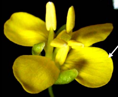
sepal (กลีบเลี้ยง)