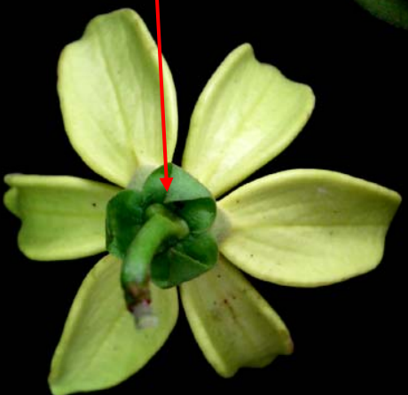
stamen (เกสรเพศผู้)