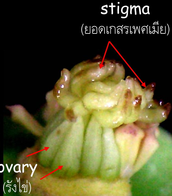
stigma (ยอดเกสรเพศเมีย)